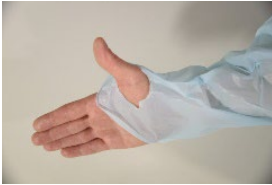
Vaihtoehto 1: peukalo peukalolenkin läpi.