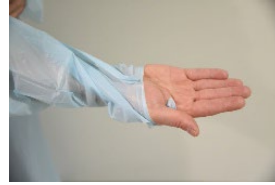
Vaihtoehto 2: Peukalolenkki otetaan peukalon ja kämmenen väliin.