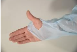
Vaihtoehto 1: peukalo peukalolenkin läpi.