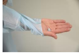
Vaihtoehto 2: Peukalolenkki otetaan peukalon ja kämmenen väliin.